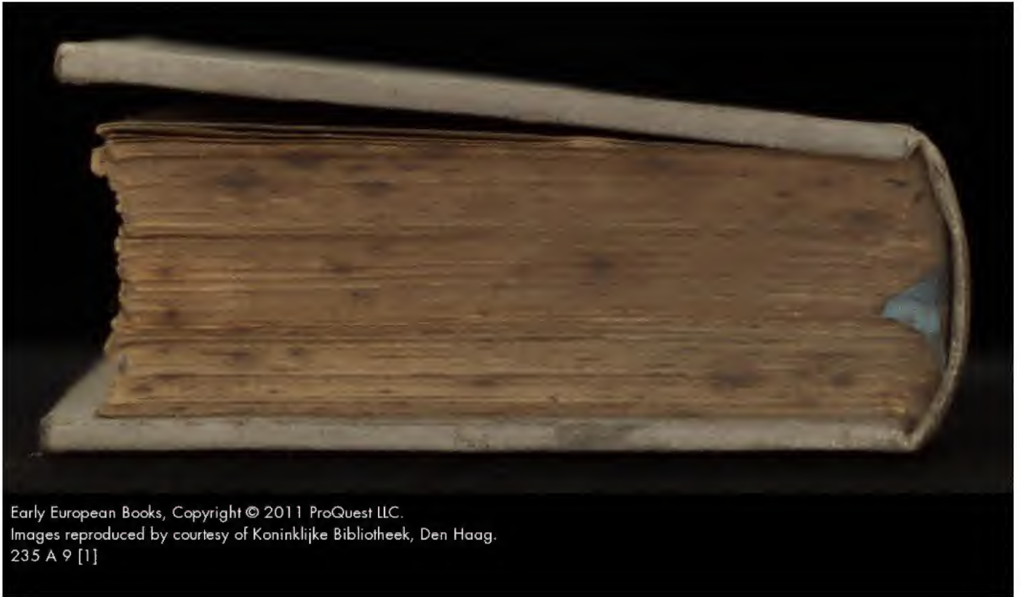
235 A 9 [1]